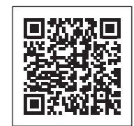
ホームページ QRコード

義務化されました。ご理解とご協力をお願いいたします。詳しい内容については、市ホームページでご確認ください。