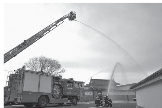
文化財防火デーに伴う消防訓練 (2020年1月24日 赤穂城跡)

(参考：環境省ホームページ「産業廃棄物の不法投棄等の状況(平成30年度)について」)