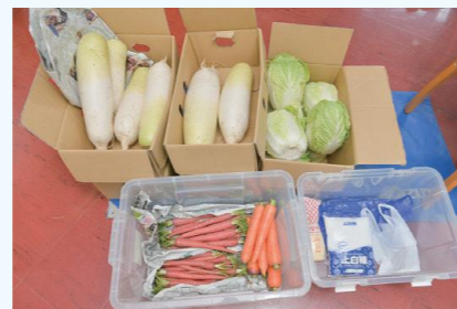
▲この日フードバンクあこうに届けられた食品