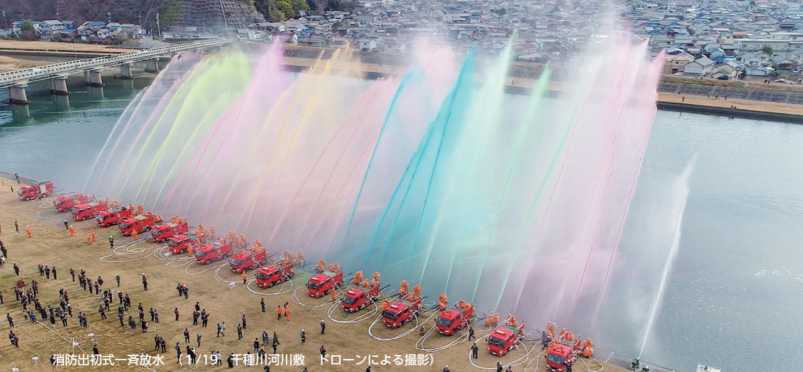
消防出初式一斉放水 (1/19 千種川河川敷 ドローンによる撮影)