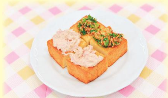
(料理協力: 赤穂市いずみ会)