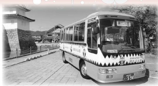
株式会社ウエスト神姫 赤穂営業所 赤穂市加里屋中洲3丁目53-1 ☎43・3325

【会社概要】 ●本社所在地 相生市電泉町394-1 ●事業内容 乗合・貸切旅客運送事業 自家用自動車管理業 旅行業者代理業 ●営業所拠点 赤穂営業所、相生営業所、山崎営業所 ●車両保有台数 定期車84台 貸切バス13台 ●従業員 196名