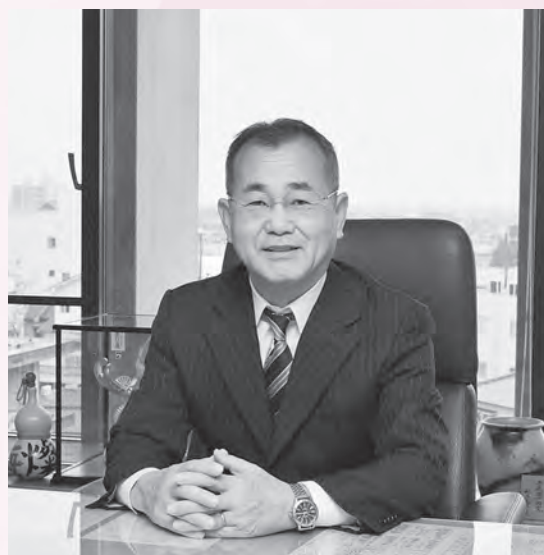
赤穂市長 明石元秀

平成28年の新春を迎え、謹んで新年のごあいさつを申し上げます。市民の皆さまには、新たな夢と希望を胸に、良き年をお迎えのことと心からお慶び申し上げます。