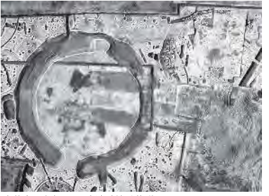
赤穂市 有年原・田中遺跡墳丘墓群

〒678-1181 有年榎原1164番地1 よくみよーばば TEL・FAX 49-3488 入館無料 ■開館時間■ 午前10時～午後4時 (入館は午後3時30分まで) ■休館日■ 火曜日、年末年始 (12月28日～1月5日) ■Webサイト■ 「有年考古館」で検索!