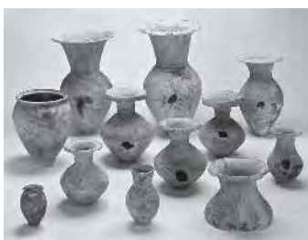
神戸市 玉津田中遺跡出土土器(兵庫県指定文化財) 兵庫県立考古博物館蔵