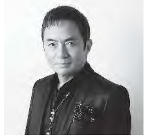
俳優 西郷輝彦さん 大石内蔵助役として義士行列特別出演

義士祭本部では、西尾市吉良町より三州吉良太鼓の演奏が12時25分から行われます。