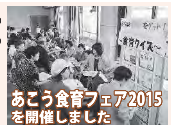
あこう食育フェア2015を開催しました

10月19日、総合福祉会館で「あこう食育フェア」が開催され、来場者は健康チエックや食育クイズをして楽しみました。試食コーナーでは、赤穂市いずみ会手作りの米粉入りパウンドケーキが振る舞われ好評でした。地産地消コーナーでは、生産者と会話をしながら旬の農作物や加工品を購入することができました。また、料理教室では赤穂の郷土料理「つなし寿司」作りに挑戦。魚をさばき、酢につけ、にぎります。「つなし寿司を作るのは初めてだけど、上手にできました」と参加者の声がありました。