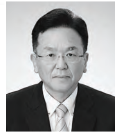
赤穂市副市長 児嶋 佳文

市民の皆様方のご理解とご支援をお願い申し上げます。就任のあいさつとさせていただきます。