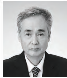
赤穂市教育長 尾上 慶昌

この度、教育長を拝命し、その職責の重さを感じるとともに、微力ではございますが、赤穂市の教育行政に誠心誠意取り組んでいく覚悟でございます。