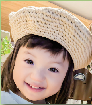
元気いっぱい！笑顔いっぱい！ 大きくなってね