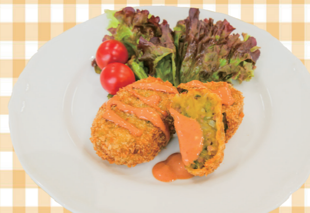
(料理協力:赤穂市いずみ会)