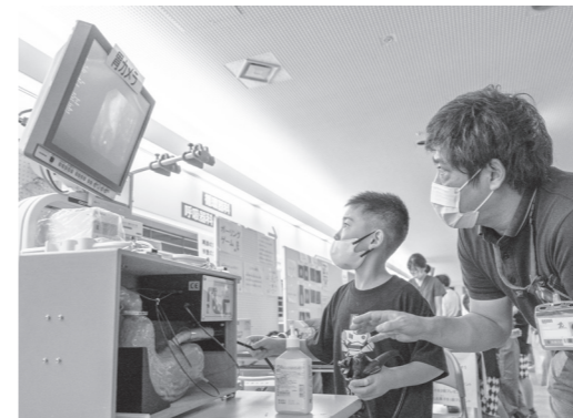
胃カメラ操作体験