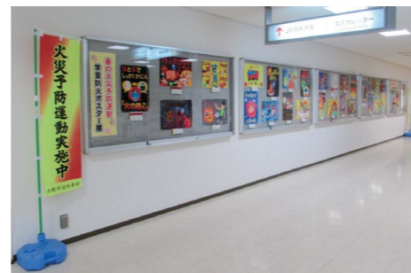
昨年度のポスター展の様子 (プラット赤穂2階)