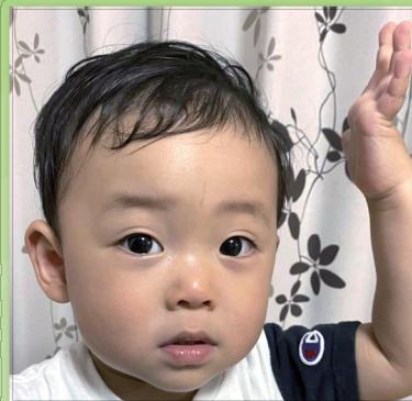
遅しく、みんなも笑顔にする 優しい子になってね！