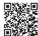
申告受付に関するHP

令和4年度の市県民税の申告受付について、詳しくは市民税係に問い合わせるか、市ホームページをご覧ください。