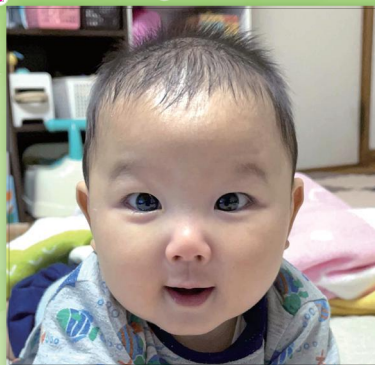
いつも元気いっぱい！ありがとう