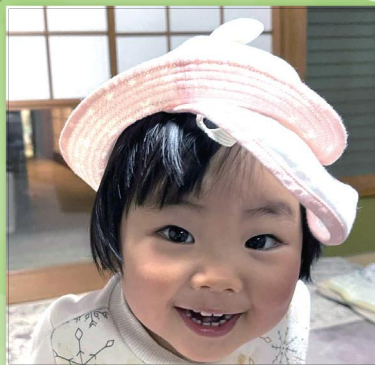
いつも明るい笑顔もありがとう