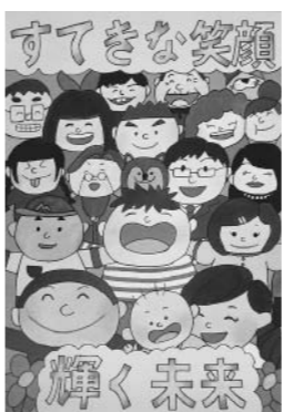
ポスターの部 最優秀賞作品

か、出初式や義士祭、年末警戒、春の火災予防運動などでの警備や広報活動、自治会の訓練指導など地域に密着した幅広い活動を行っています。 また、普通救命講習の指導補助や一人暮らし老人宅への防火診断などでは、女性消防団員による細やかな対応が好評を博しています。私たちと一緒に家族や地域の皆さま、赤穂のため活動しましょう。