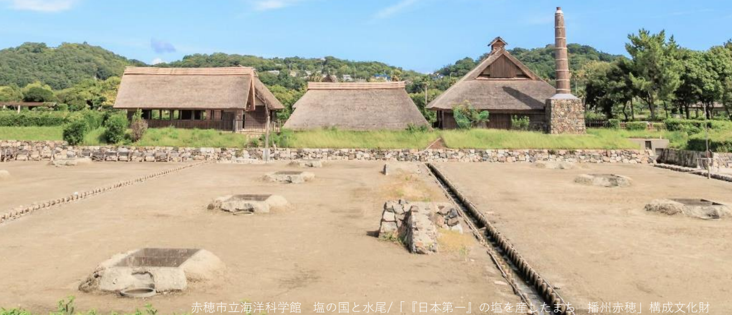
赤穂市立海洋科学館 塩の国と水尾 / 「『日本第一』の塩を産したまち 播州赤穂」構成文化財

2つの企画展を同時開催 赤穂市立図書館1階ギャラリー 2.10[土] ▶ 2.18[日]