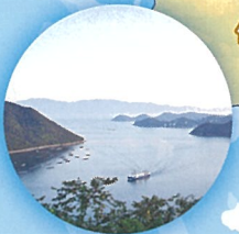
みなとの見える丘公園