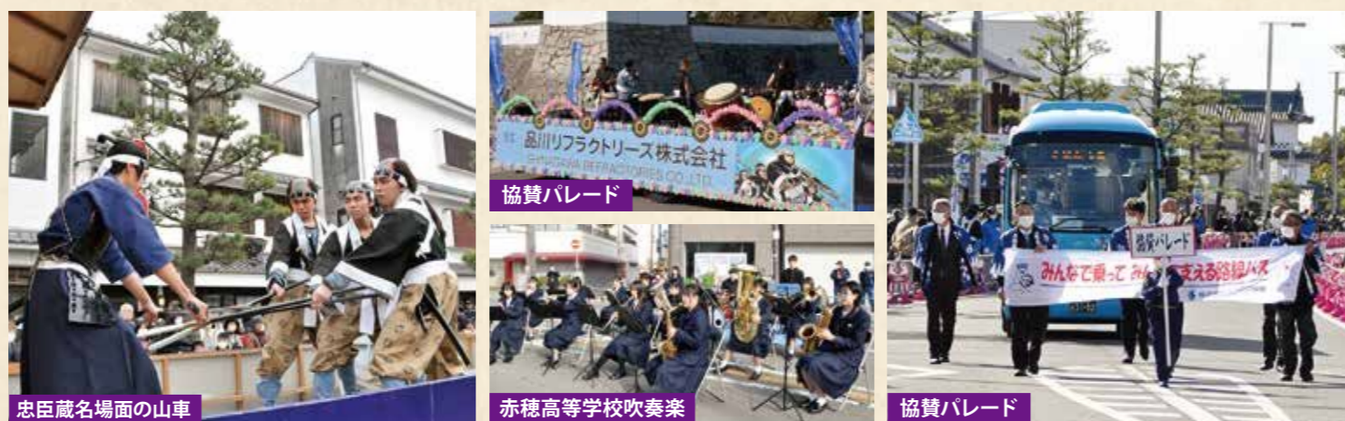
忠臣蔵名場面の山車