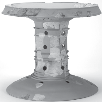
有年牟礼・山田遺跡 1号墓出土 大型装飾器台

今回の展示では文化財指定を記念し、有年牟礼・山田遺跡をはじめとする赤穂市内の墳墓遺跡とそこから出土した土器をもとに、弥生時代から古墳時代にかけて、地域社会がどう変化したかを解き明かします。