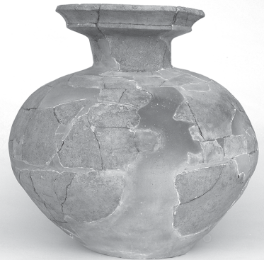
有年牟礼・山田遺跡 1号墓出土 大型二重口縁壺