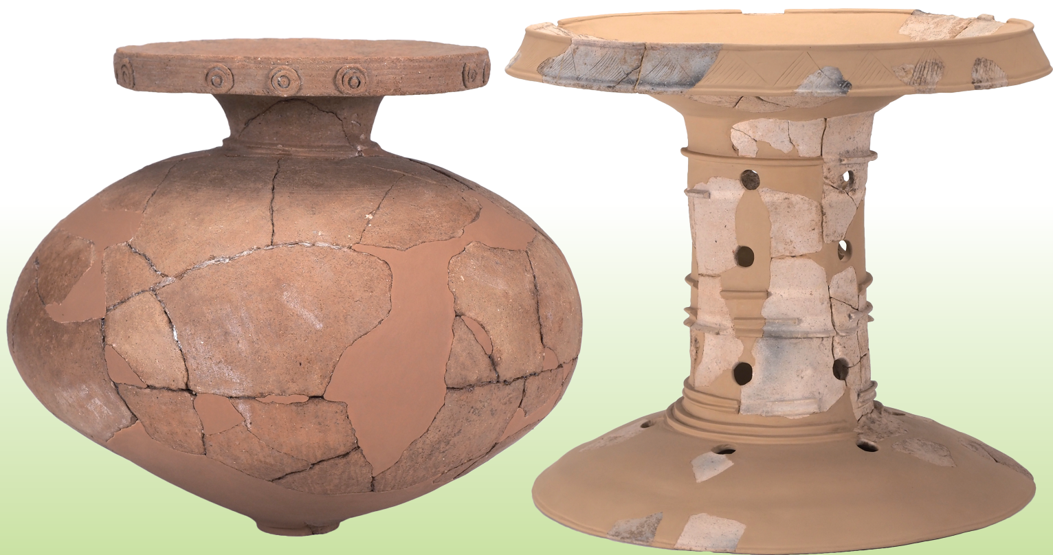
有年牟礼・山田遺跡出土土器 加飾壺および大型装飾器台