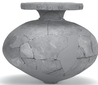
有年牟礼・山田遺跡 1号墓出土 加飾壺