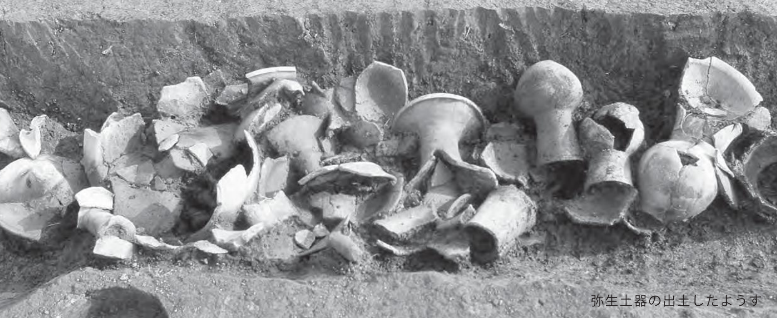
弥生土器の出土したようす