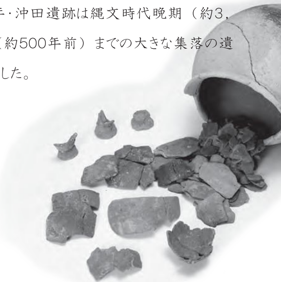
弥生時代の製塩土器と甕

今回の展示では、史跡指定30周年を記念して、東有年・沖田遺跡の発掘調査成果を紹介し、そのひみつに迫ります。