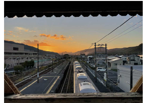
@kein_lander 様 題名 「夕陽を眺めて」 撮影場所 吉永駅