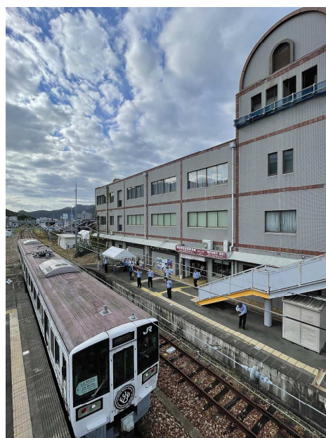
@du4nicht9siehst 様 題名 「特別な日にラマルドボア」 撮影場所 伊部駅