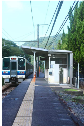
@vuan4512 様 題名 「無人駅とローカル線」 撮影場所 寒河駅