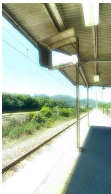
@yua8017 様 題名 「夏のはじまり」 撮影場所 天和駅