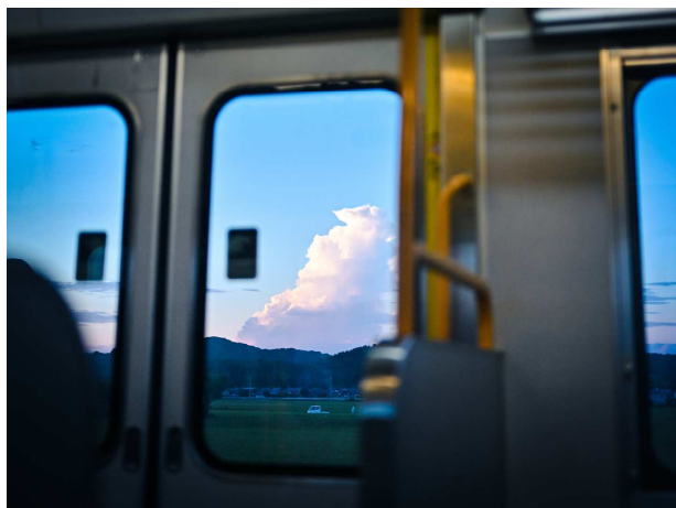
@aoyamaa____ 様 題名 「夏帰省」 撮影場所 吉永駅