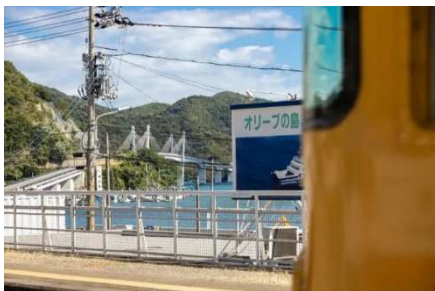
@seki.ts 様 題名 「島へ」 撮影場所 日生駅