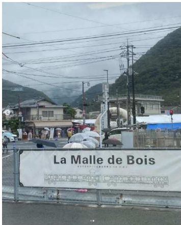
@hitujidoshishishiza 様 題名 「雨模様の備前焼祭り」 撮影場所 伊部駅