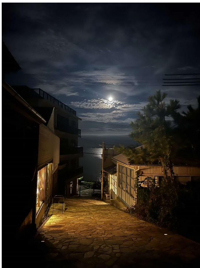
「夜のキラキラ坂」 田淵 隆聖