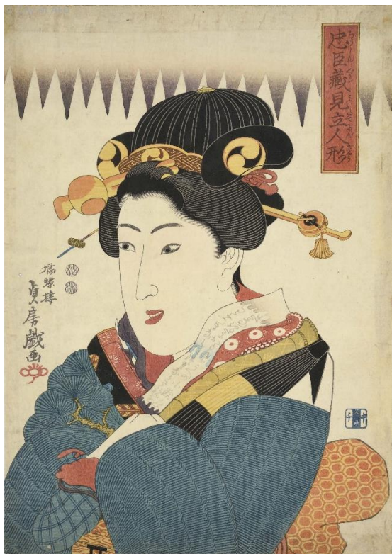
■ 貞房「忠臣蔵見立人形」(AkoRH-R0155)