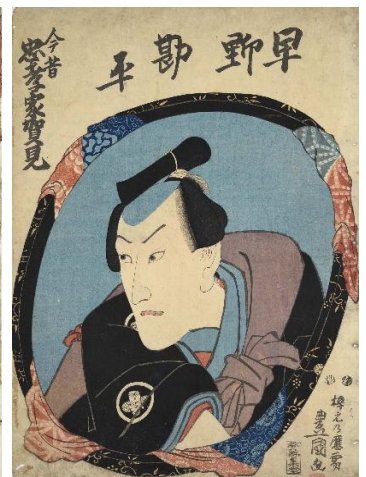
■ 豊国III「今昔忠孝家賀見 早野勘平」(AkoRH-R0074)