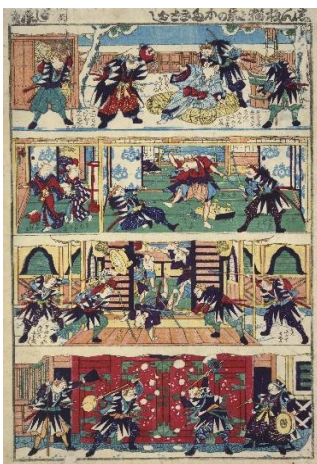
■ 芳藤「しん板猫と鼠のかたきどおし」(AkoRH-R0165)