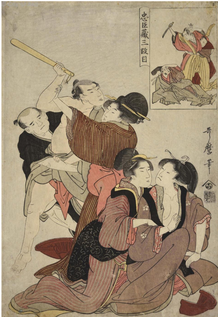
■ 歌麿 I 「忠臣蔵 三段目」(AkoRH-R0271)