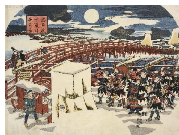
■ 国丸「忠臣蔵十一段目夜討之図」(AkoRH-R0201)