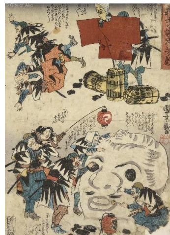
■ 国芳「義士の誠忠芳蔵」(AkoRH-R0150)