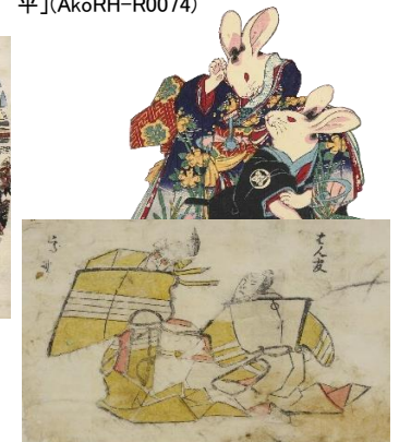
■ 無款「はん官・高野」(arcUP4796)