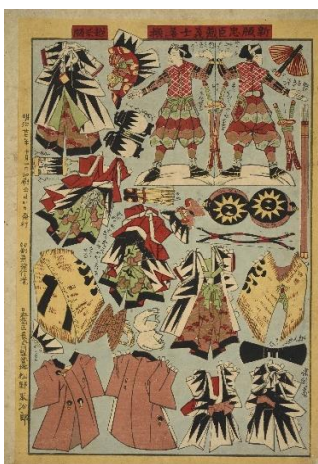
■ 国利「新版忠臣蔵義士着せ換」(AkoRH-R0183)