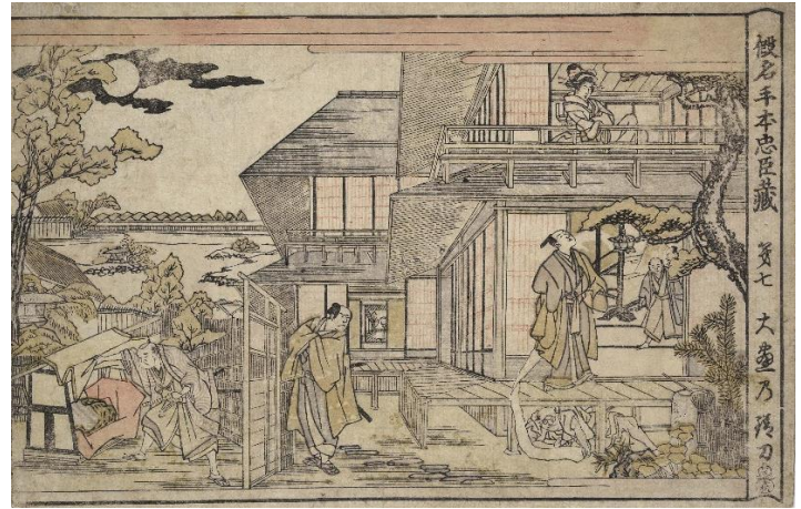
■長秀「仮名手本忠臣蔵 第七 大尽の錆刀」(AkoRH-R0349-06)