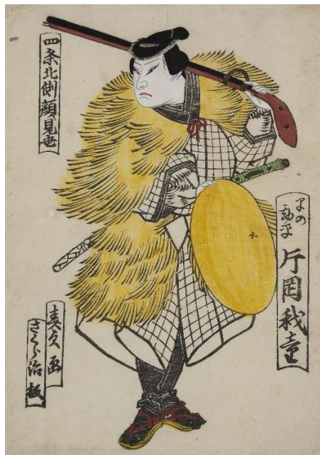
【上】■広貞「忠列義士伝 三 大星由良之助」(AkoRH-R0334)／【下】■春貞「四条北側顔見世 早の勘平 片岡我童」(shiUY0216)