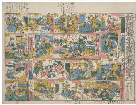
■無款「新板仮名手本忠臣蔵飛廻双六」(AkoRH-R0190)