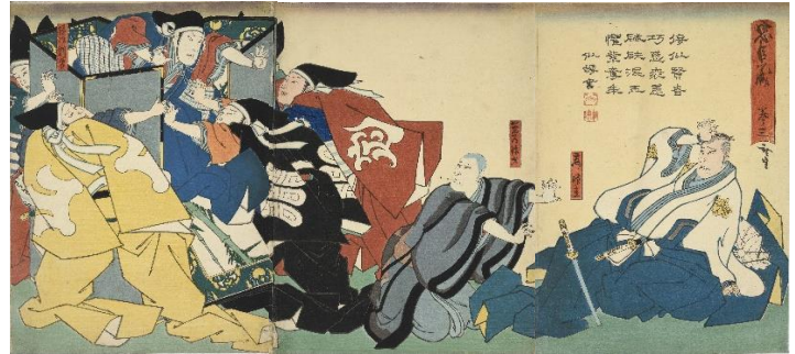
■広貞「忠臣蔵 巻ノ三」(AkoRH-R0330-01~03)