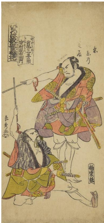
■長秀「四条北東の芝居 いろは歌普桜花」(arcUP8646)