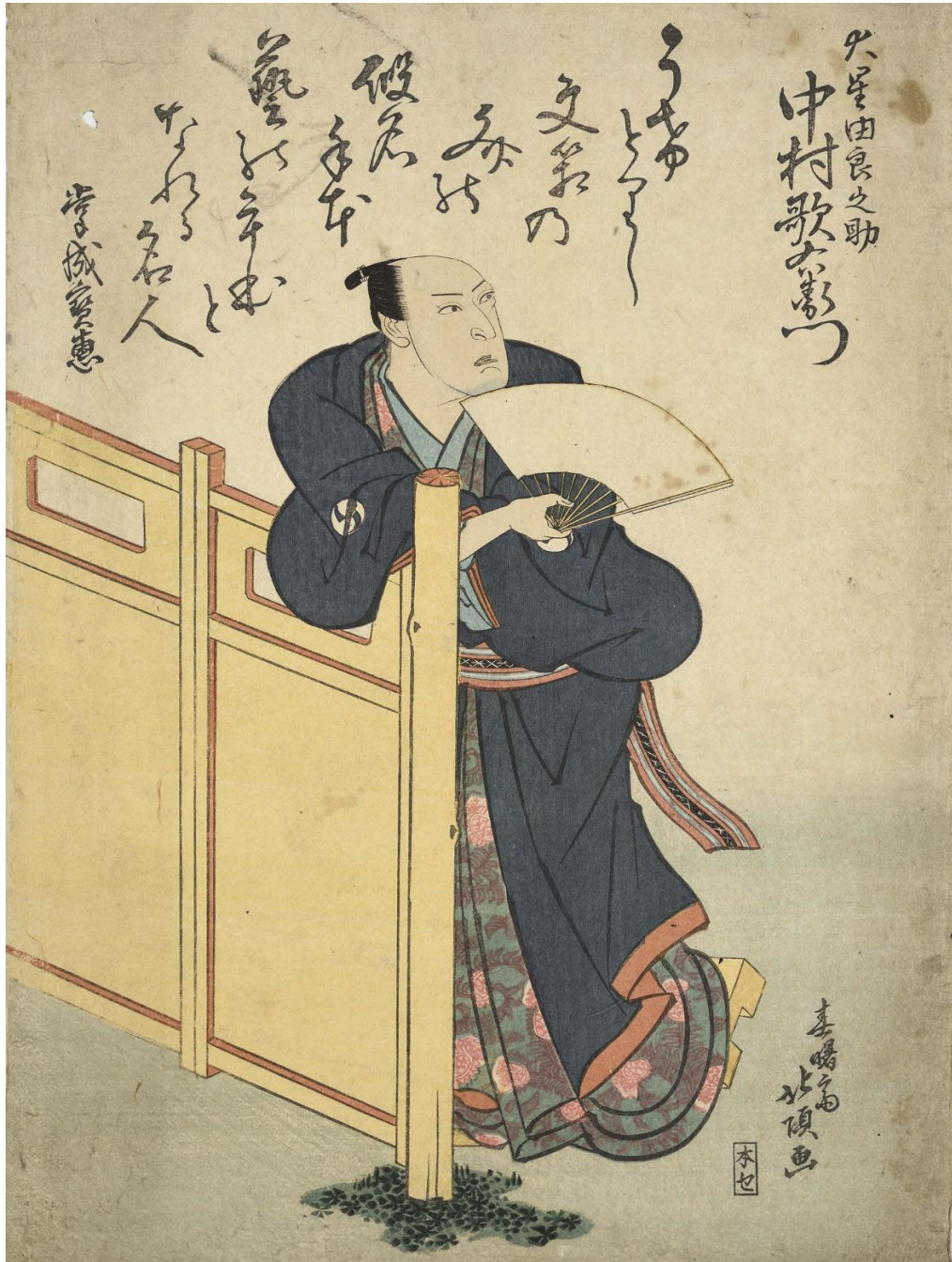
■北頂「大星由良之助 中村歌右衛門」(AkoGA-G0002)

赤穂市ホームページ ( https://www.city.ako.lg.jp ) 内の 赤穂市「忠臣蔵」浮世絵データベース入口からアクセス!