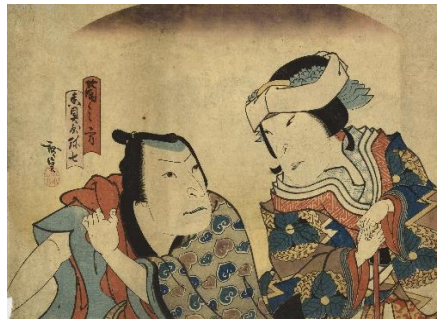
■広貞「蘭の方 香具屋弥七」(AkoCH-S0039)