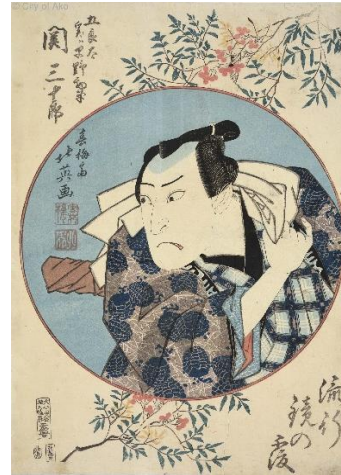
■北英「流行鏡の覆 五良太実ハ早野勤平 関三十郎」(AkoRH-R0333)