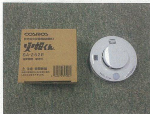
住宅用火災警報器（煙式）

高齢者宅からの火災及び逃げ遅れを未然に防ぐとともに、住宅用火災警報器を設置することにより、住民の住宅防火に対する意識の高揚及び住宅用火災警報器の普及促進を図ります。