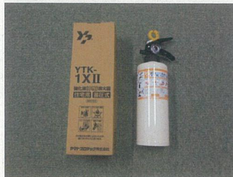
住宅用消火器（蓄圧式）

https://www.city.ako.lg.jp/shoubou/keibou/kobayasi.html 赤穂市／住宅用火災警報器等の配布モデル事業の実施地区に選ばれました