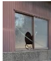
窓が割れた管理不全空家