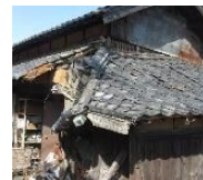
緊急代執行を要する崩落しかけた屋根