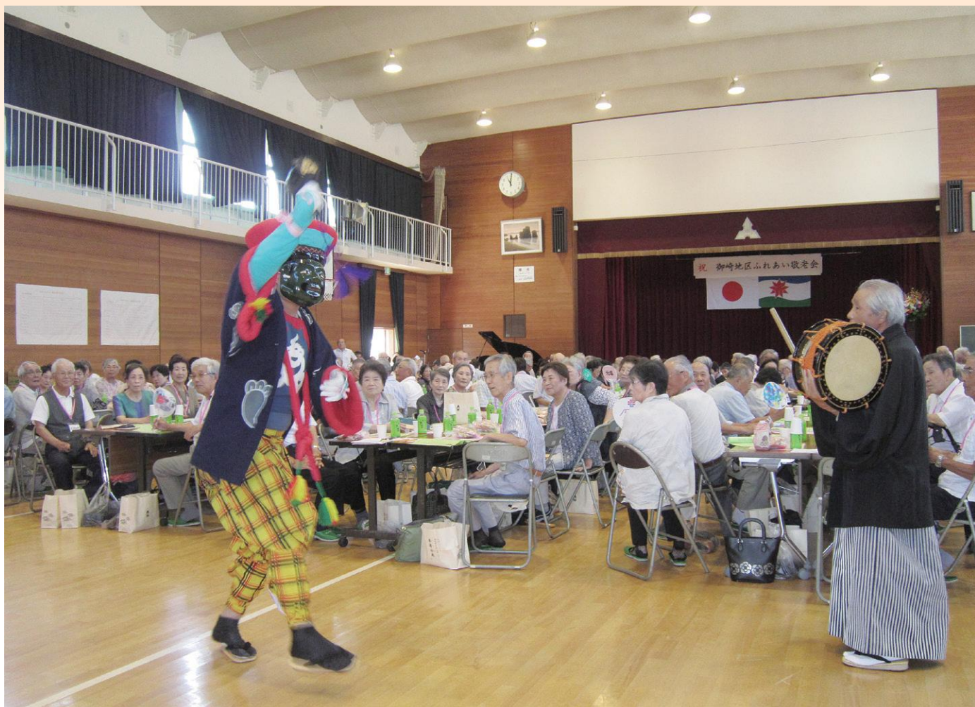
9月15日 御崎地区ふれあい敬老会