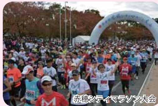
赤穂シティマラソン大会