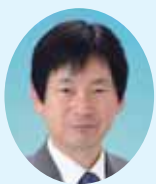
議長 瓢 敏雄