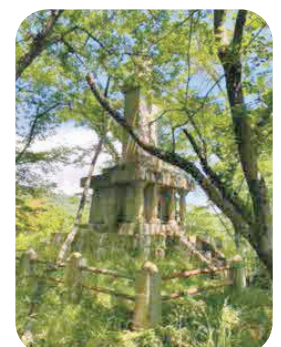
以良羅山に鎮座する塩屋の忠魂碑