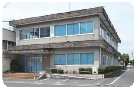
旧上下水道部庁舎

答 現在閉鎖している旧つつじ荘は草刈り等の維持管理を市が行っている状況である。施設利用に関しては、これまで公募等は行っておらず、今後の活用については、事業者から借り受けたい等の申し出があれば協議していきたい。旧上下水道部庁舎については、令和3年度にアスベスト調査を実施し、本年度は解体・撤去のための実施設計を行う予定である。また、跡地利用については、市民サービスの向上につながる有効な活用方法について検討していく。