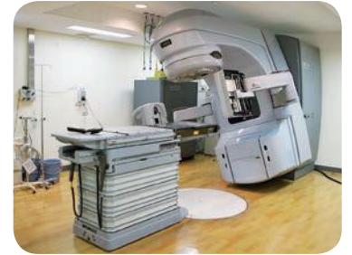
放射線治療機器（ライナック）

答 放射線治療機器ライナックの稼働状況については、令和2年度で1,809件、令和3年度で1,801件の実績となっている。また患者の病院に対する評価を知るための手段として、市民病院では従前から患者の意見を伺うための「患者様の声BOX」の設置をはじめ、入院患者を対象とした「入院アンケート」を行っているほか、外来患者を対象とした「接遇アンケート」を実施している。今後も患者の声に対して真摯に向き合い、信頼され選ばれる病院になるよう努力していく。