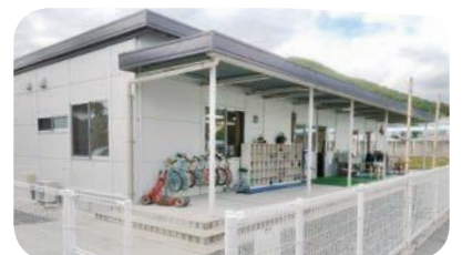
尾崎アフタースクール

答 令和3年度の放課後児童支援員研修の修了者は4人であり、引き続き支援員・補助員に関わらず受講を推進するとともに、資質向上研修等にも積極的な受講を促していく。補助員等の確保については広報紙等での募集や人材の情報収集に努め、支援員の負担軽減に向け調整を図る。学校施設の利用については学校と協議を行い、各地区アフタースクールの状況に応じ対応している。今後もアフタースクール代表者会議等で情報共有を図り、必要に応じて関係部署と協議を行い、関係所管課が連携を図りつつ、児童が安全に過ごせる環境整備に努めていく。