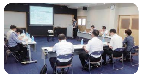
郡上市産業プラザにて

愛知県西尾市 インフラ整備において、橋梁・横断歩道橋・トンネル長寿命化修繕計画、舗装の個別施設計画に基づき、健全度、第三者被害の有無、緊急輸送路、津波避難経路等による優先度を判定。水道施設は主要施設の耐震補強工事、重要管路の耐震管への更新、下水道はストックマネジメント計画等により、工事計画を立案し、限られた財源と管理体制の下で、効果的かつ効果的な維持管理が行われている。