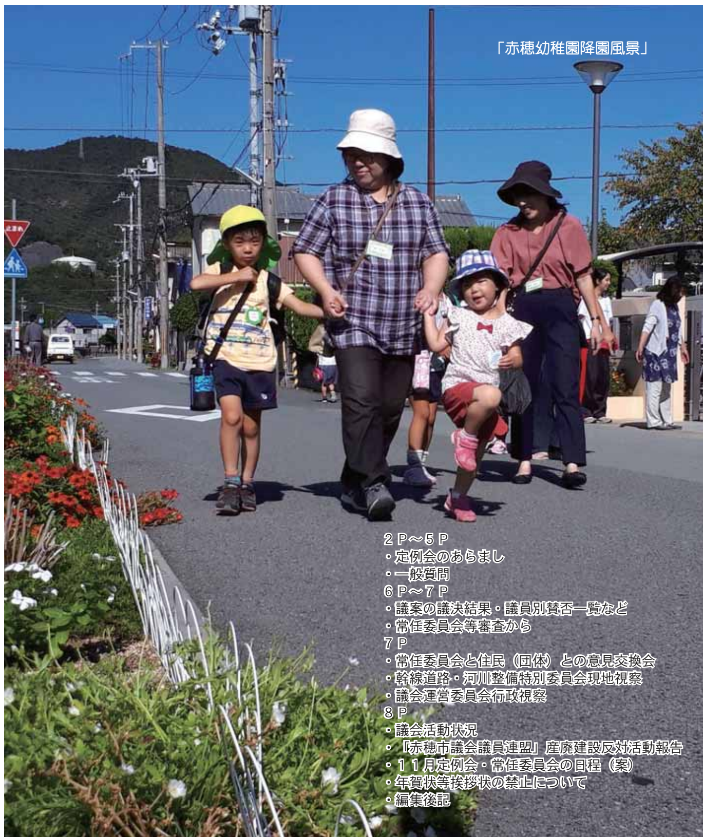
「赤穂幼稚園降園風景」