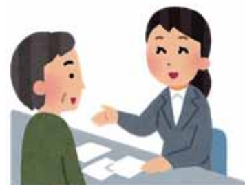
福祉なんでも相談窓口

答 「福祉なんでも相談窓口」の新設については、現在、高齢者、子ども、障がいのある方、生活困窮者などに対応する総合相談窓口を各設置し専門相談に応じており、相談者や家族等の状況等によっては関係部署、関係機関等と連携体制もあることから、窓口の新設ではなく、各相談機能の連携強化による包括的な支援体制の一層の充実を考えている。伴走型支援については、各種手続きの対象者への通知、申請時、相談員等による窓口への同行、他機関との連携調整を図るなど一層の寄り添った対応に努めたい。