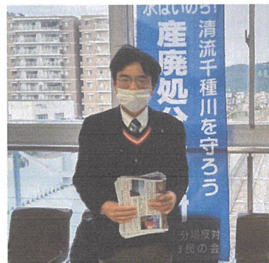
赤穂市議会議員連盟による 赤穂市各駅でのビラ配布時

市議会議員全員が加盟する、産廃計画に反対する赤穂市議会議員連盟でも活動を行っています。上郡町で住民投票が行われ圧倒的反対多数となり産廃建設阻止に向けての動きが進む一方で、産廃計画を進める業者側の動きも活発化するなど予断を許さない状況です。赤穂市の自然環境と未来を守っていくために今後も市民の皆さんと協力し、頑張っております。