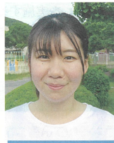
赤穂保育所 0歳児ひよこ組

子どもがニコッと笑顔を見ると、とても嬉しく思います。たくさん笑顔に出会えるよう関わってきたいです。