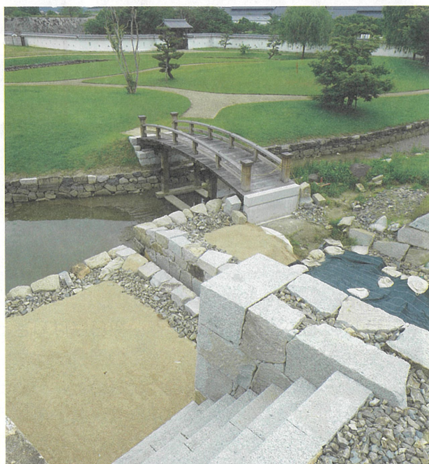
整備が進む二之丸西中門周辺

なお今年度は、市制70周年記念事業として「まるごと赤穂城博」と題し、赤穂城に関する様々なイベントを開催する予定ですので、ご期待ください。