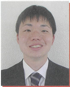
赤穂小学校 5年2組担任