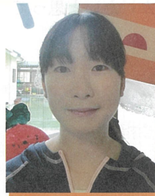
塩屋保育所 3歳児クラス

子どものよさをたくさん見つけ認めることができ、常に温かくかかわることができる先生になりたいと思っています。