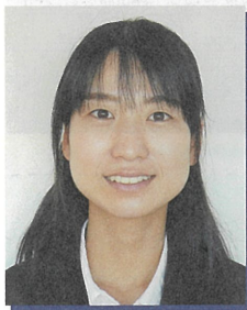
高雄小学校 たんぼぼ学級担任

学校を支える側として、しっかりと責任を持って職務に取り組み、頼られる存在になりたいです。