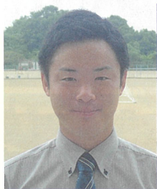
赤穂中学校 2年3組担任国語科

児童が活動に一生懸命取り組み、児童のやり切ったときの笑顔や達成感を感じている姿を見たときにやりがいを感じます。