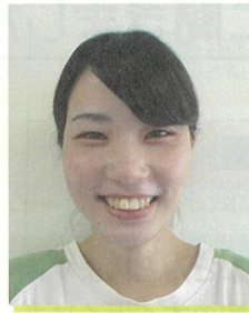
城西幼稚園 年長 みどり組担任

生徒を元気に、笑顔にできる先生になります。また、生徒の成長と共に自分も成長していきたいと思っています。