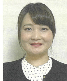
城西小学校 養護教諭

子ども一人ひとりに寄り添い、信頼され、大好き！と思ってもらえるような保育士になりたいです。