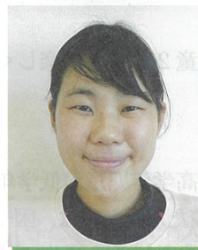
坂越保育所 0歳児クラス

新しい手遊びやピアノの練習です。担当の子どもは歌が好きなので、その思いに寄り添えるよう引き出しを増やしている所です。