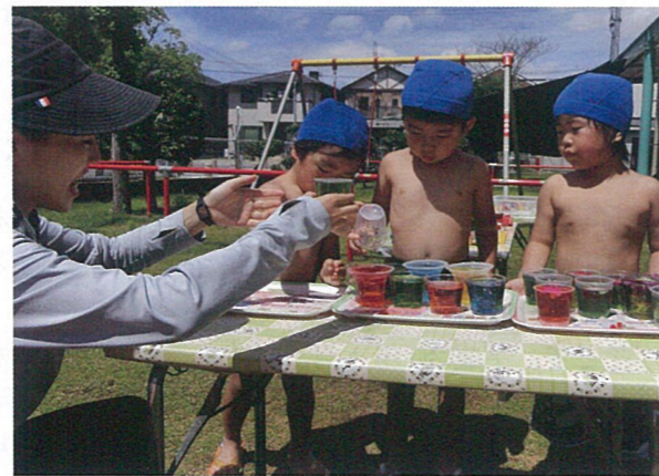
色水あそび～ジュースやさんごっこ～ 「いらっしやいませ。どれにしましょうか。」