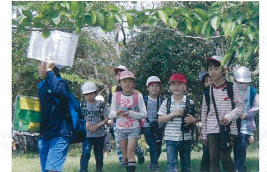
異学年(縦割り班)でのオリエンテーリング

市民総合体育祭のスウェーデンリレーで男子が4連覇しました。兵庫リレーカーニバルでも昨年は決勝、今年は準決勝へと進出するなど、子どもたちの活躍が続いています。