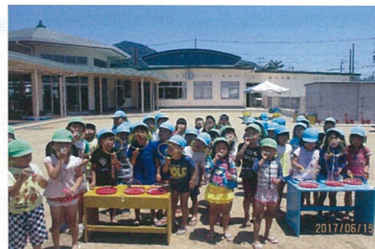
みんなでシャボン玉 楽しいな！

ピカピカの新園舎に113名の園児たちの笑顔がはじけ、元気一杯の音が響いています。園庭の花も咲き誇り、加屋川沿いのアジサイも色鮮やか。花に囲まれた明るい幼稚園です。