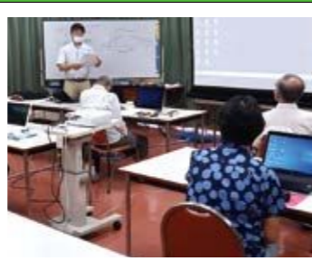
【スマートフォン・パソコン講座】

季節に応じたフラワーアレンジメントや寄せ植えを楽しみました。いつも心が癒やされます。