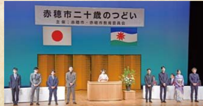
< 二十歳のつどい実行委員のみなさん >

式典では、教育長からの式辞、市長ほか来賓の方からのお祝いの言葉をいただき、また、代表として2名の方が二十歳の抱負として、これまでの感謝の気持ちや将来への力強い決意を述べました。