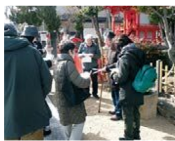
【日本の歴史発見講座】

「古典文学と兵庫の街かど」と題して神戸の須磨地区でフィールドワークを行いました。