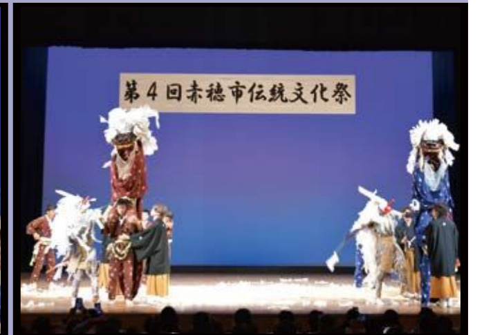
尾崎獅子舞保存会

令和6年11月9日(土)に第4回赤穂市伝統文化祭が、赤穂市文化会館赤穂化成ハーモニーホールにて開催されました。