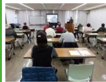
【赤穂の魅力再発見講座】