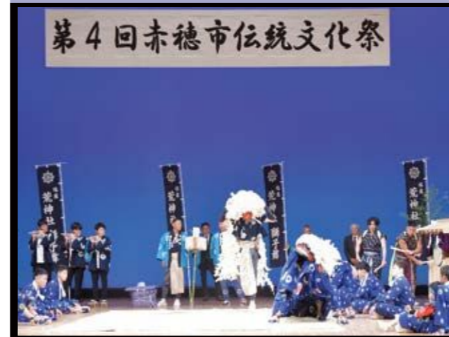
塩屋荒神社獅子舞保存会