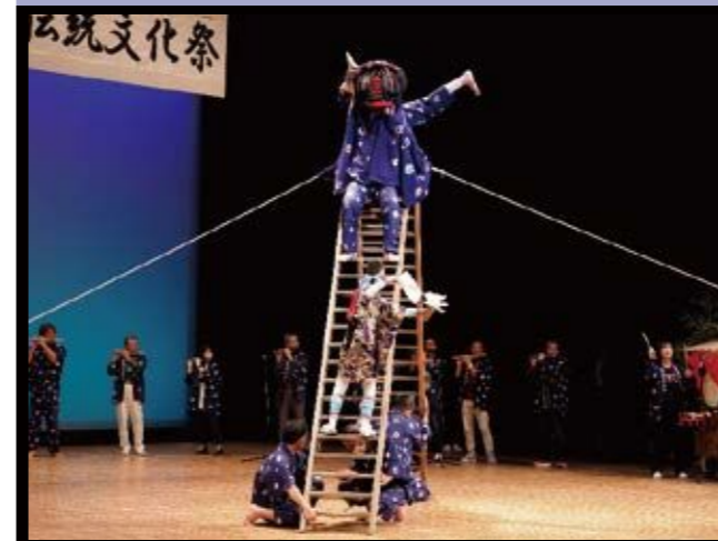
天和獅子舞保存会